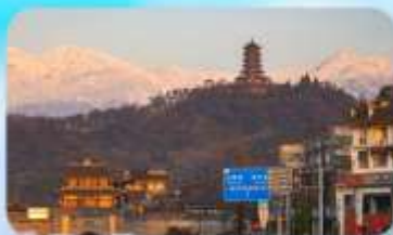
เมืองโบราณกวนเสี้ยน