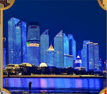
หาดเซเบอร์ฟังก์