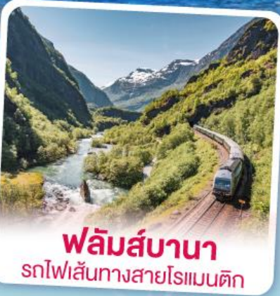
พลัมส์บานา รถไฟเส้นทางสายโรแมนติก