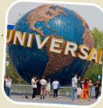
5 UNIVERSAL BEIJING