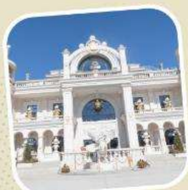
6 POP LAND