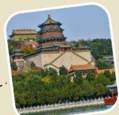
4 พระราชวังฤดูร้อน