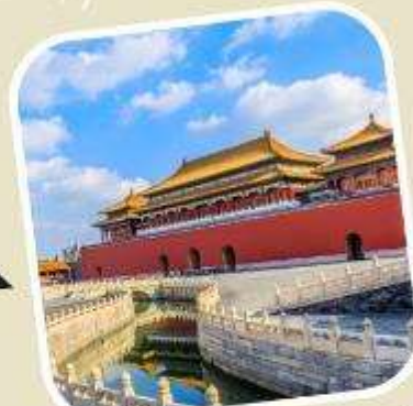
3 พระราชวังต้องห้าม