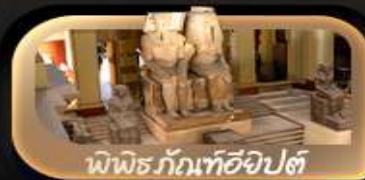
พิพิธภัณฑ์อียิปต์

✂️ อาหาร 9 มื้อ + บนเครื่อง + 🏨 ที่พักโรงแรมดี 4 ดาว + 🍷 บริการน้ำดื่ม 5 วัน: 2 ขวด + 📶 ฟรีแล็กไฟ Universal