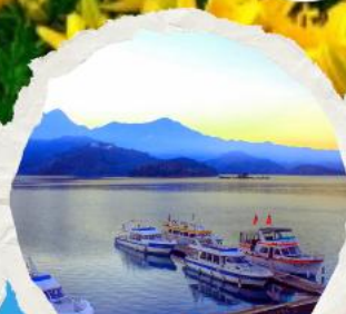
ทะเลสาบสุริยขึ้นจินทารา