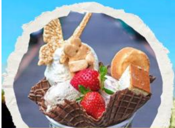
ร้าน ไอศกรีมมิยาซาร่า