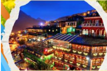
หมู่บ้านโบราณฉิวเฟิง