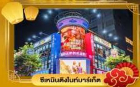
ช้อปปิ้งดิงโถกมาร์เก็ต