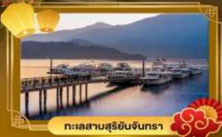
ทะเลสาบสุรยีนจินตรา