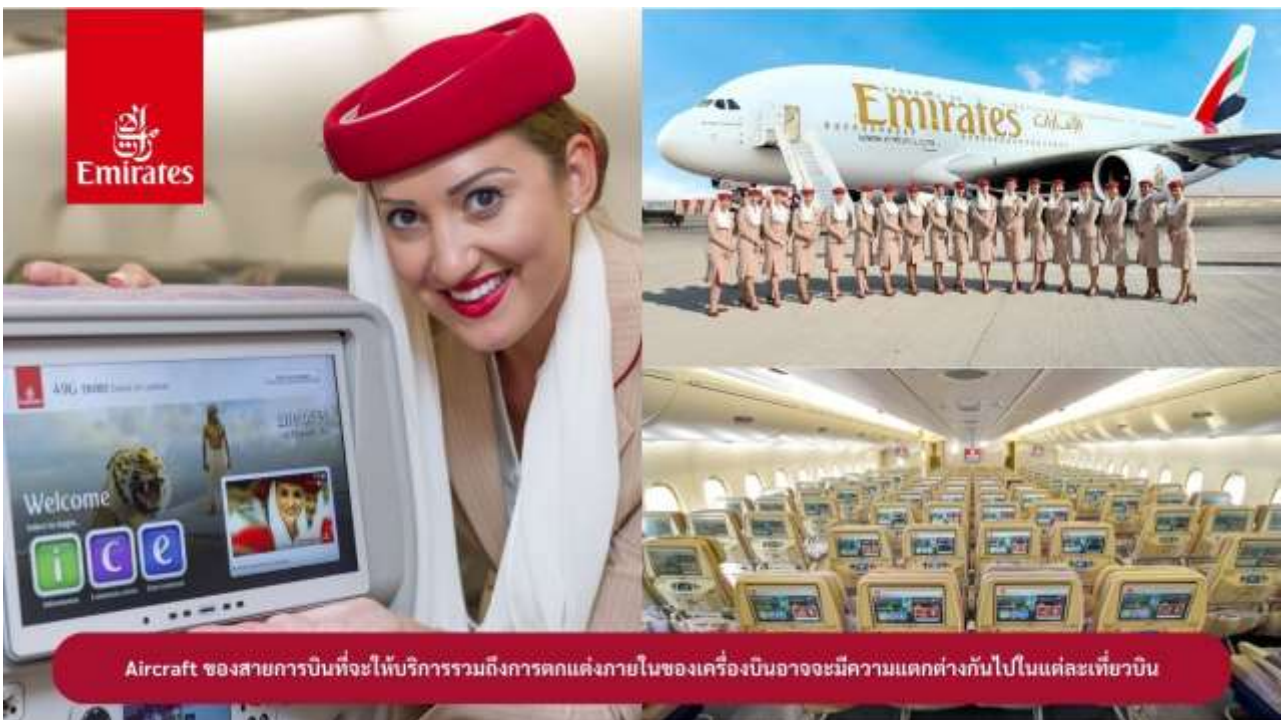
Aircraft ของสายการบินที่จะให้บริการรวมถึงการตกแต่งภายในของเครื่องบินอาจมีความแตกต่างกันไปในแต่ละเที่ยวบิน

20.35 น. ✈ ออกเดินทางสู่ เมืองดูไบ ประเทศสหรัฐอาหรับเอมิเรตส์ โดยสายการบินเอมิเรตส์ เที่ยวบินที่ EK373 (🍽️ บริการอาหารและเครื่องดื่มบนเครื่องบิน)