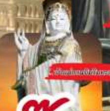
วัดเทพศิรินทราวาส