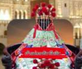
วัดบวรนิเวศราชวรวิหาร