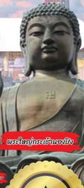
พระใหญ่กระเช้านองยี่ง