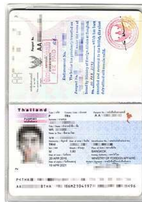
Passport เต็ม 2 หน้า