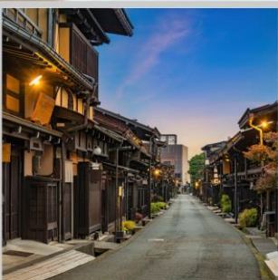
“TAKAYAMA OLD TOWN”