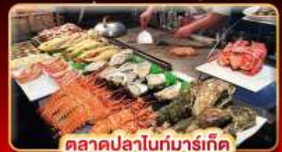
ตลาดปลาไถ่บาร์เก็ด