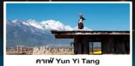
คาเฟ่ Yun Yi Tang