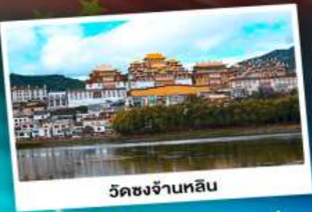
วัดชงจันหลิน