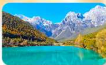
ทะเลสาบโป๋สุยเหอ