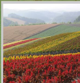
"SHIKISAI NO OKA"