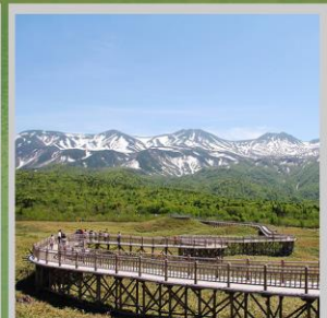
"SHIRETOKO 5 LAKES"