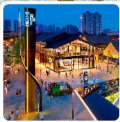
ถนนคนเดินไท่กุหลี่