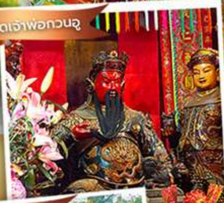
วัดหลินฟาง