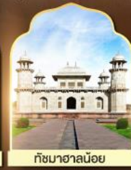
ถ้ำมาฆาลน้อย