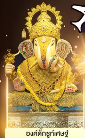
องค์ดีกษุท์เศษฐ์