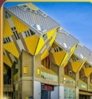
บ้านลูกเต๋าโคกคูบัส

“ล่องเรือหลังคากระจก” ชมกรุงอัมสเตอร์ดัม