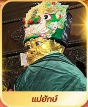
แม่ยักษ์