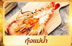
กุ้งแม่น้ำ