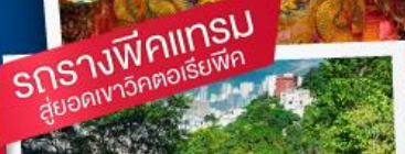
รอรางพืดแถม สู้ออกเที่ยววัดตอเรือพิศ