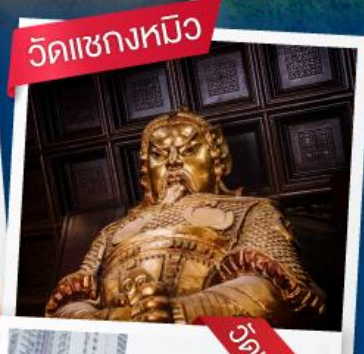
วัดเขangkงหนิว