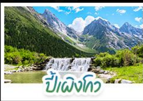
ปี้เฉิงโกว