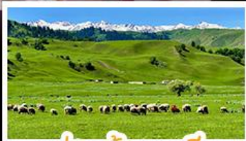
ทุ่งหญ้าานาลาถิ