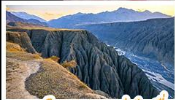
แกรนด์แคนยอนตู่ชานจื่อ