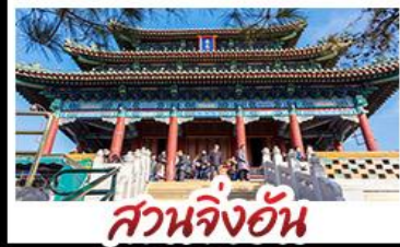
สวนจิ้งอัน