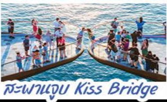
สะพานจูบ Kiss Bridge