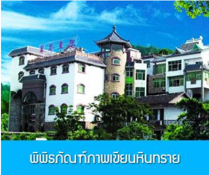
พิพิธภัณฑภาพเขียนหินทราย