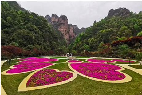
อุทยานฟงเหลียนซี