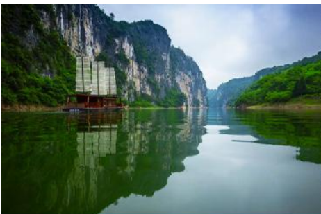
ล่องเรือ เหมามาเหยียนเหอ