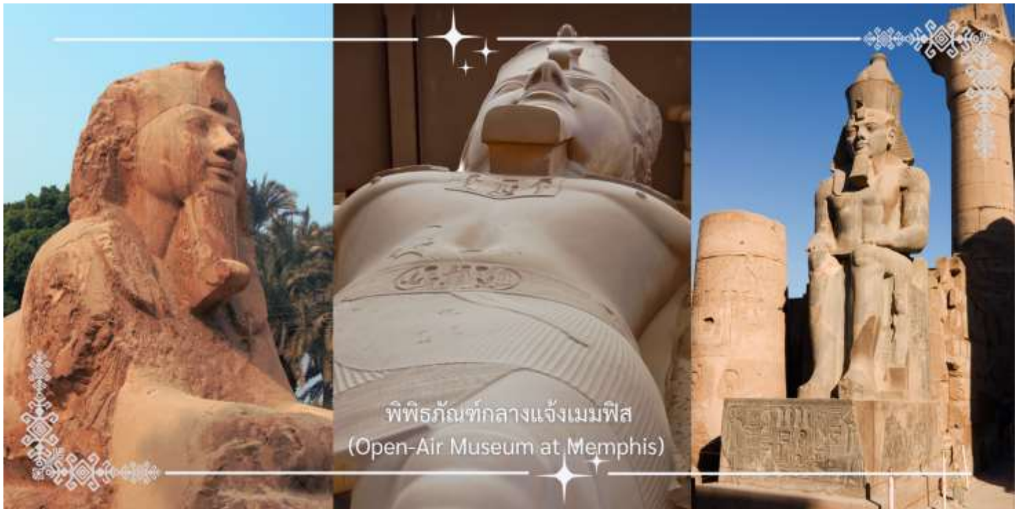
พิพิธภัณฑ์กลางแจ้งเมมฟิส (Open-Air Museum at Memphis)

นำท่านเดินทางสู่ ซัคคารา (Saqqara) หนึ่งในสุสานหลวงที่สำคัญที่สุดของอียิปต์โบราณ ตั้งอยู่ทางใต้ของกรุงไคโร เป็นส่วนหนึ่งของเนโครโพลิสแห่งเมมฟิส ที่นี่ถือเป็นต้นแบบของการสร้างพีระมิดในยุคแรกเริ่ม และยังเป็นที่ตั้งของพีระมิดขั้นบันได (Step Pyramid) อันเลื่องชื่อของฟาโรห์โจเซอร์ (Djoser)