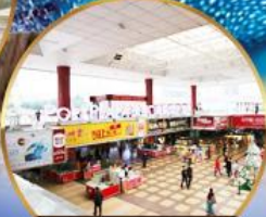
ตลาดกังเป๋ย