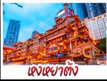
ตงเฉยฮาดัง