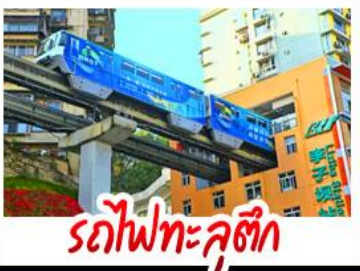
รถไฟทะลุติ๊ก