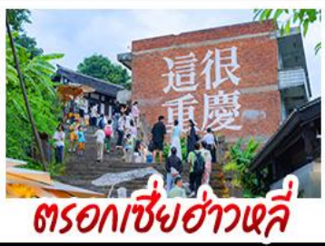
ตรอกเซี่ยฮ่าวหลี่