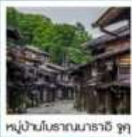
หมู่บ้านโบราณนารายิ จุกุ