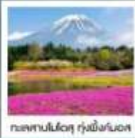
ทะเลสาบโมโตสุ ทุ่งพืชมอส