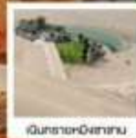
ดินแดน-ดินแดน