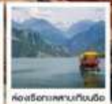
ห้องพักผ่อนกับเรือ