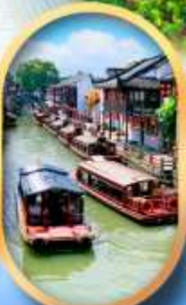
ถนนชานกิ่งเจีย