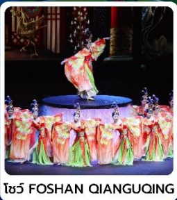
โชว์ FOSHAN QIANGUING