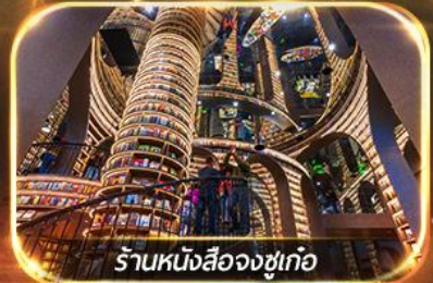
ร้านหนังสือจงซูเท่อ

เที่ยวชมทัศนียภาพ 2 อุทยาน ปี้เฟิงโก & ชวงเจียวโก