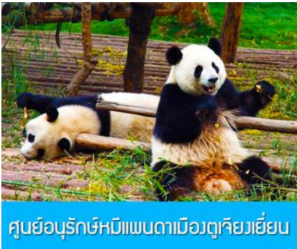
ศูนย์อนุรักษ์หมีแพนด้าเมืองตูเจียงเขียน

หลังอาหารท่านสามารถเลือกที่จะซื้อโปรแกรมทัวร์เสริม หรืออิสระพักผ่อนตามอัธยาศัยในโรงแรม