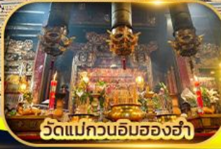
วัดแม่กวนอิมฮ่องฮ่า