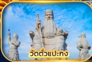
วัดตัวแปะกง