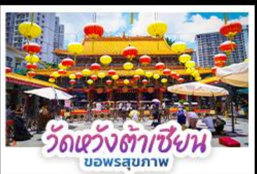
วัดแห่งต้าเซียน บอพรสุขภาพ