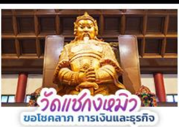
วัดแห่งกวงเมียว ขอโชคลาภ การเงินและธุรกิจ