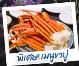
พิเศษ! เมฆงาปู