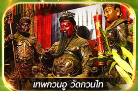
เทพกวนอู วัดกวนไท

ไหว้พระ-จัดเต็มขอพร 9 วัดดัง, นั่งกระเช้ามองปิง สักการะพระใหญ่โป้วหลิน ทะเลสาบดิสนีย์แลนด์ ชมพลุสุดอลังการ !!