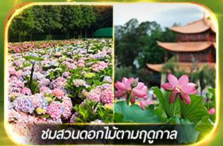
ชมสวนดอกไม้ตามฤดูกาล

นั่งกระเช้ากุเขาศิมะเจี้ยวจื่อ ชมน้ำตกสุดอลังการสวนน้ำตกคุนหมิง ช้อปปิ้งถนนคนเดินหนานผิงเจี๋ย, ชมดอกไม้ตามฤดูกาล