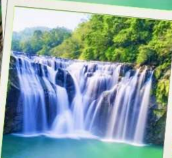
น้ำตกสีโอเฟิน