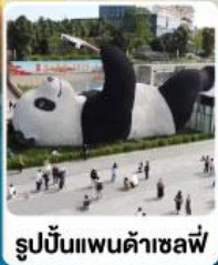
รูปปั้นแพนด้าเซลฟี