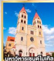
มหาวิหารเซนต์ไมเคิล