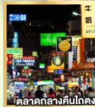
ตลาดกลางคืนโกตง