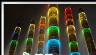
น้ำพุไม้ไผ่ตึกSKP