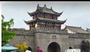
เมืองโบราณกวนเซี่ยน

ภูเขาสี่ดรุณี - อุทยานป่ฝิ่งโกว - สะพานหนานเฉียว - ร้านหนังสือจงซูเก้อ - เมืองโบราณกวนเสียน จตุรัสหยางเทียนหวู่ - หมีแพนด้าเซลฟี - ถนนโบราณซอหยวงซอหยวน - ถนนคนเดินไท่กู่หลี่ ถนนคนเดินซุนซี - ถนนโบราณจิ่นหลี่ - แพนด้ายักษ์ปิงตึก - น้ำพุไม้ไผ่ตึกSKP - วัดต้าเจี๋ย