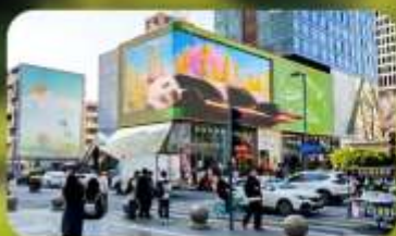
ไท่กุ่หฺสึ