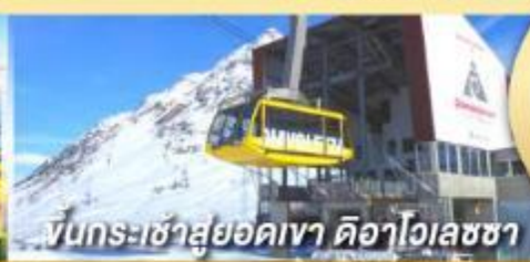
ขึ้นกระเช้าสู่ยอดเขา ดือาโกลเลซซา