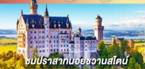
ชมปราสาทนอยชวานสไตน์