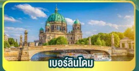
เบอร์ลินโดม