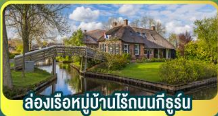
ล่องเรือหมู่บ้านไรน์บนทีกูร์น