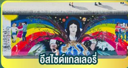
อีสไซด์แกลลอรี่