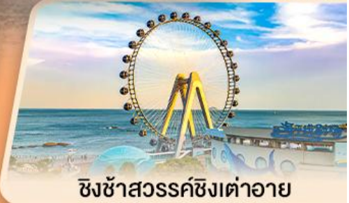
ซิงซ่าสวรรค์ซิงต้าอาย