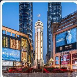
ถนนเจียฟางเป่ย์