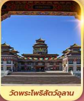
วัดพระโพธิสัตว์อูลาน