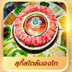
สุกใสโตลมองโก