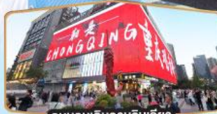
ถนนคนเดินถวณอันเฉียว