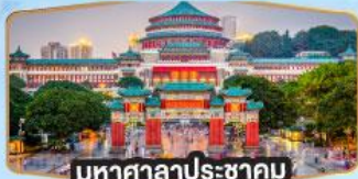
มหาศาลาประชาชน